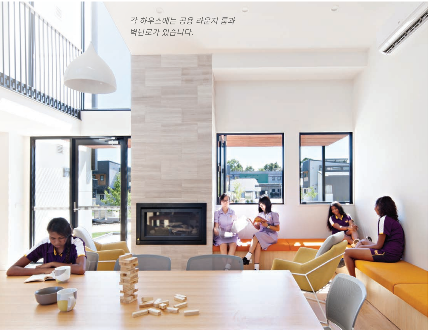
각 하우스에는 공용 라운지 룸과 벽난로가 있습니다.