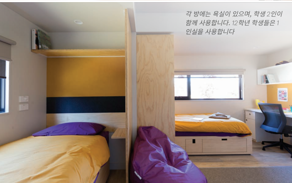
각 방에는 욕실이 있으며, 학생 2인이 함께 사용합니다. 12학년 학생들은 1인실을 사용합니다